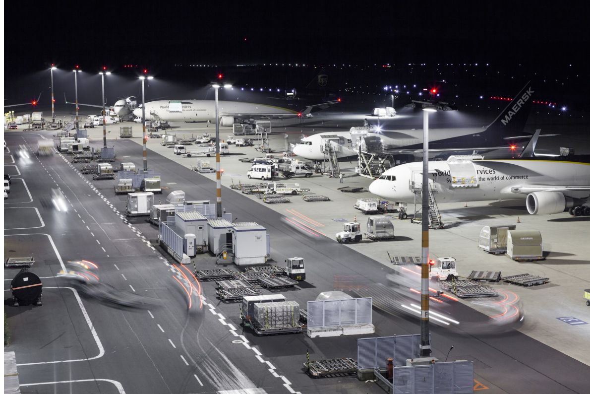
# 59: NACHTS IM UPS AIR HUB